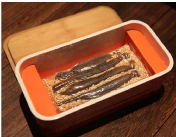
图 A.1 糯米红参